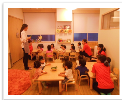
栄養士さんによる食育活動