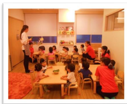
栄養士さんによる食育活動